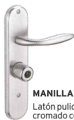
MANILLA Latón pulido o cromado cepillado